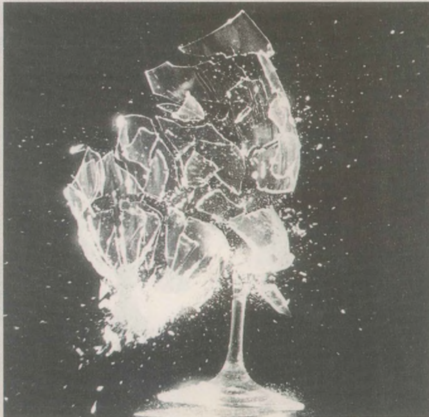
Kontrolsüz gerilim tehlikeli olabilir

Halkı yoksullaştırma politikaları, daha derin ve yıkıcı sonuçlar doğuracağı bir zemine sıçrayacaktır. Sosyal haklar iyice tırpanlanacaktır. Kuralsızlaştırılmış iş yaşamı kalıcılaşacak ve "kural"lar büsbütün terk edilecektir. Küresel ekonomideki en ufak bir "kırılma" dahi "zayıf halka" ülkelerden Türkiye'yi misliyle etkileyecek ve şimdilerde çok konuşulan ciddi bir "çöküş" ise, doğrudan "iflas" noktasına itecektir. Öte yandan, doğrudan küresel sermayenin çıkarlarıyla ilişkili olan bölgemizdeki iş-gale hizmetin gerekleri de daha güçlü biçimde AKP'ye dayatılacaktır. Yerli sermayenin bölgesel açılımları da aynı doğrultuda talepler yaratıyor.