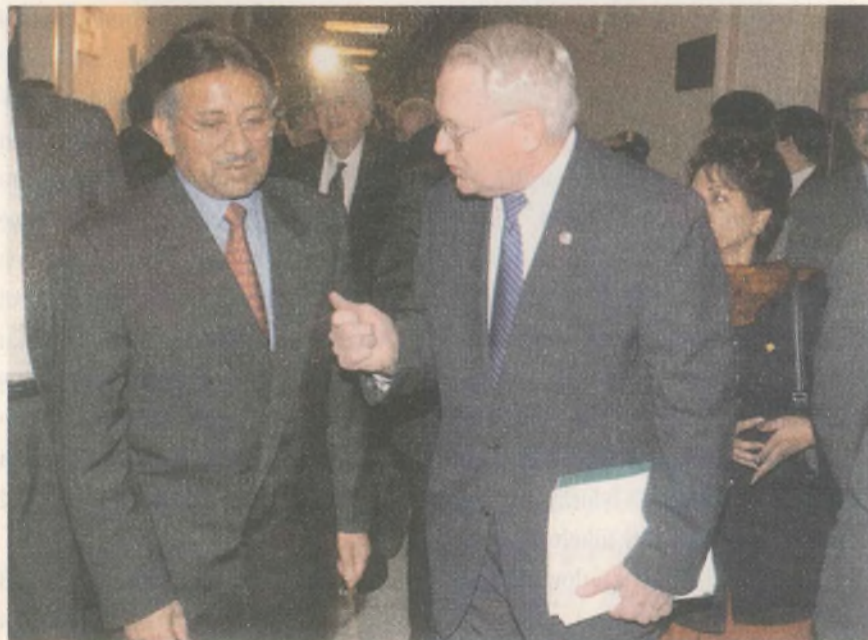
Müşerref iktidarını korumak için manevralar yapıyor

Afganistan'daki Sovyet yanlısı yönetimin devrilmesi ve Sovyetler Birliği'nin çökmesinin ardından, iki ülkedeki köktendinci yapılanmalar, -savaş boyunca edindikleri askeri ve siyasi tecrübenin verdiği güvenle- cihadın yönünü bu kez ABD'ye ve Pakistan'daki Batı yanlısı yönetimlere çevirdiler. Kendi elleriyle beslediği İslami gruplar, ABD'nin kontrolünden çıktı (Taliban ve El Kaide gibi). Pakistan'ın ağır yoksulluk ve yoksunluk içinde yaşayan, kendisine yabancılaşmış kliklerce yönetilen halkı da kurtuluş umudunu İslam'da buldu.