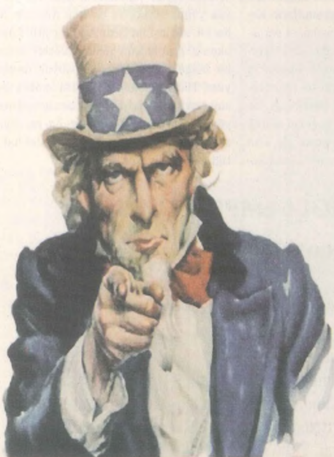
Dünya para sistemine dolar hükmediyor

Küresel kapitalist yelpazede yer alan ülkelerin, işgücü pazarlarında oluşan artıdeğer oranlarının eşitsizliği, ödeme piyasasındaki açıkların kapatılması için kullanılmaya başlandıkça, küresel değer, diğer anlamda evrensel ölçü birimi olarak paranın asimetric eğrilerini, açıklarını oluşturuyor.