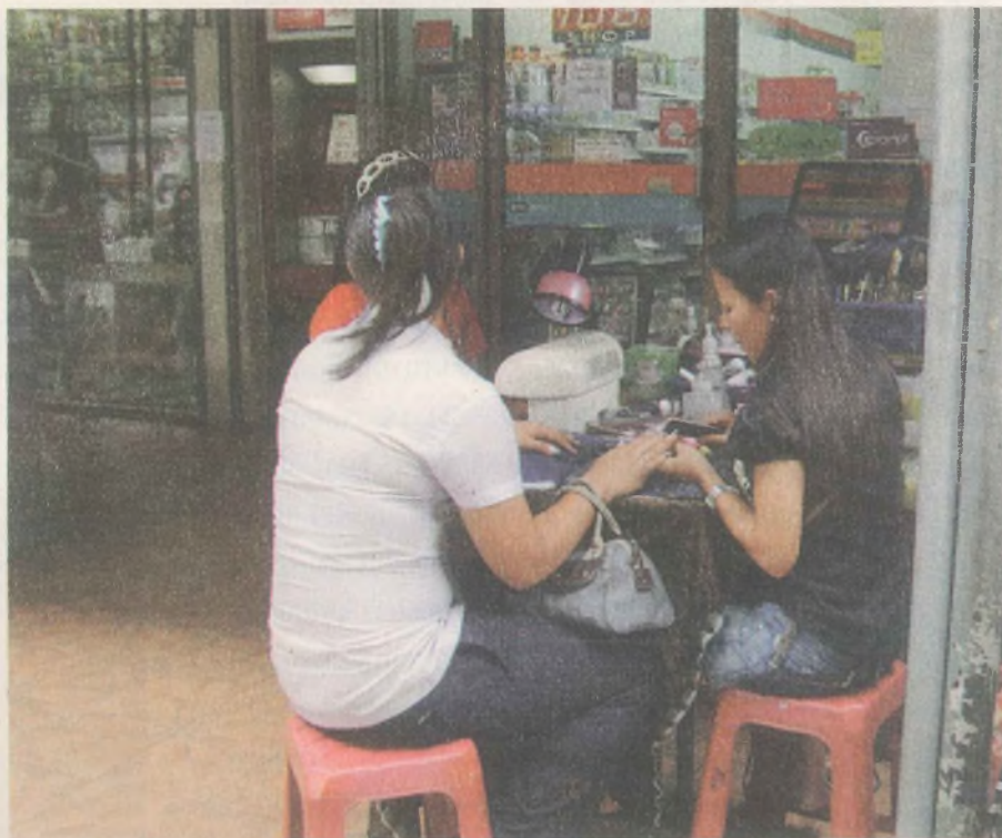
Bangkok ekonomisi kadın bedeni üzerinde yükseliyor

Çocuklar, bedenlerinin metalaştırılıp satılmalarının ötesinde, dünyanın dört bir tarafından gelen turistlere -ki salt bu gösteriler için geziler düzenleniyor- egzotik bir nesneye dönüştürülmüş durumda.