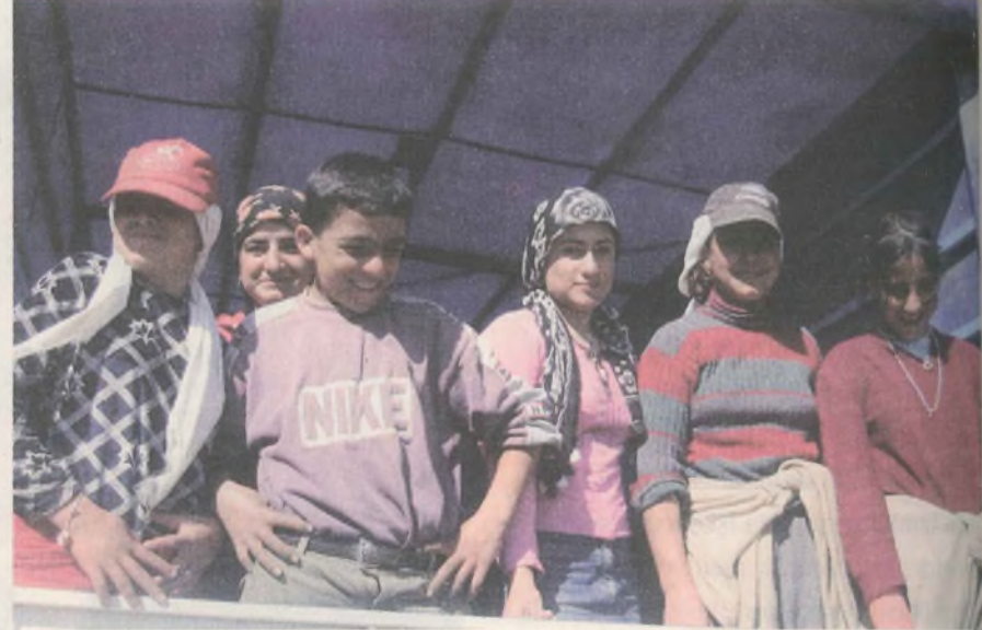
Günde 10 saatten fazla çalışmanın karşılığı 15 YTL

Bütün bunlara ilave olarak Bölge'de yaşanan savaş, köy boşaltmalar, yakmalar ve yaylaya çıkma yasağı da yoksul Kürt köylüsünü toprağından koparmıştır. Gündem Gazetesi'nden bir haber: "Fındık toplamak için binbir eziyetle çeşitli illerden Ordu'ya giden çok sayıda Kürt işçi, il merkezine alınmıyor. Kimlik kontrolü yapıldıktan sonra asker-polis gözetimine alınan Kürt işçiler, uygulamaya 'Biz de bu ülkenin yurttaşı değil miyiz?' diyerek isyan ediyor. Gittikleri Adapazarı, Giresun, Bolu, Trabzon gibi illerde yerli işçiye göre daha az