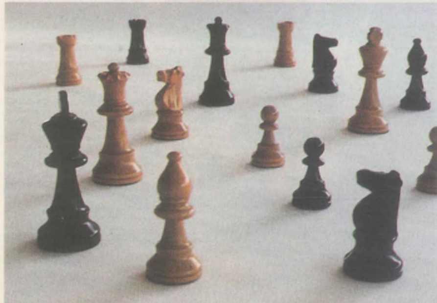
Doğru zemin taşları işlevselleştirir

21. yüzyılın Türkiye-tarihsel öznesinin kolektif bir süreç içinden, kolektif bir siyasi önderlikle yaratılması için tarih yeniden bir fırsat ve uyarı kapısını araladı. Tarihin verdiği dersi aldıktan sonra bu kapıyı; bu, aynı zamanda kendi ellerimizle açtığımız kapıyı açıp, sürecin içine boylu boyunca girecek miyiz?