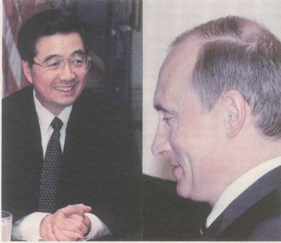
Hu Jintao ve Putin ABD'ye karşı ittifak halinde. Şimdilik!

Çin'in Şanghai şehrinde, 1996 yılında Çin, Rusya, Kazakistan, Kırgızistan ve Tacikistan devlet başkanları bir araya gelip sınır güvenliği ve terörizme karşı mücadele konusunda birlikte davranacaklarını açıkladıklarında; bu mütevazı buluşmadan dünya dengelerini değiştirecek bir ittifaka varılacağını kimse tahmin edemezdi. Ama, o sıralarda